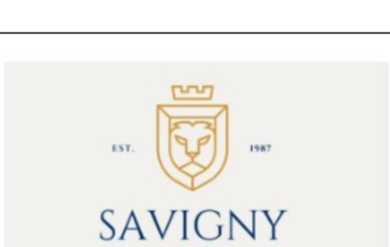
Nace Savigny, Abogados y Consultores