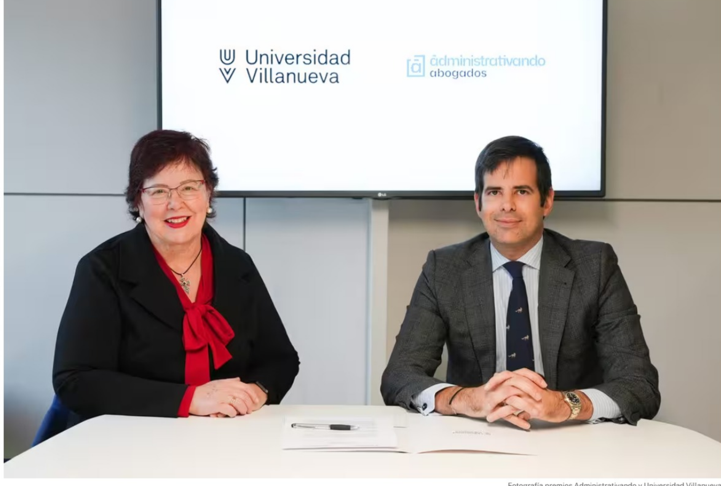
Fotografía premios Administrativando y Universidad Villanueva

La Universidad Villanueva y Administrativando Abogados reconocen los mejores trabajos de fin de grado y máster de estudiantes de Europa e Iberoamérica con una dotación económica y proyección profesional