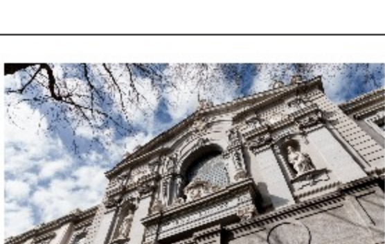
El Supremo obliga a agresores sexuales leves a asistir a cursos para prevenir la reincidencia