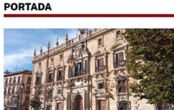
El Tribunal Superior de Justicia de Andalucía absuelve a seis acusados de narcotráfico por falta de pruebas