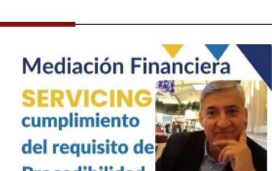
ASEMED ofrece una webinar gratuita sobre mediación financiera, servicing y requisito de procedibilidad