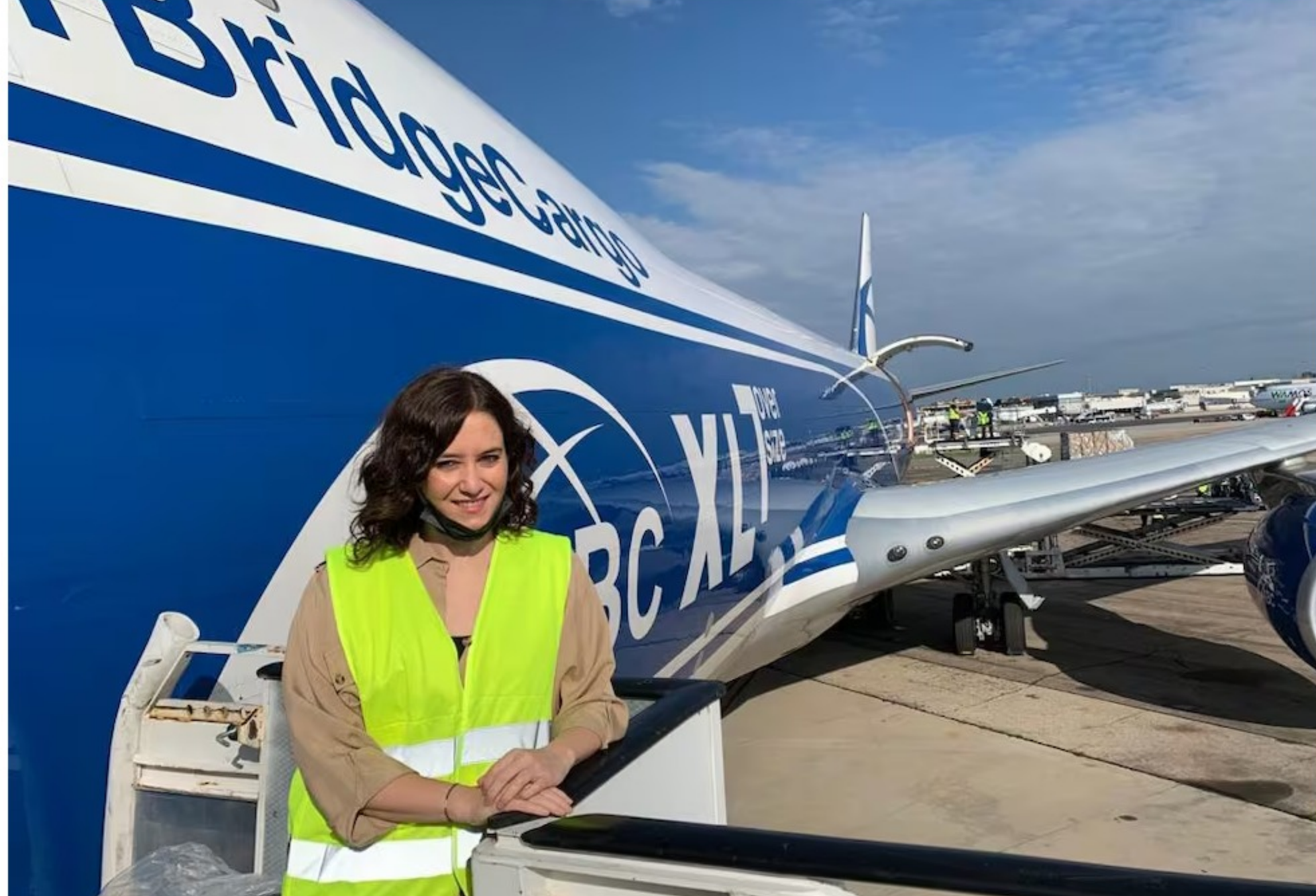
La presidenta madrileña, Isabel Díaz Ayuso, el 12 de abril de 2020 en el aeropuerto de Barajas delante de un avión de la Comunidad de Madrid con 113 toneladas de material sanitario para hacer frente a la pandemia de covid.

Los empresarios alegan que cuando entregaron la mercancía no recibieron el dinero pactado. Además, el Ejecutivo se comprometió a fletar los artículos chinos en uno de los aviones de la Comunidad de Madrid, y les negaron el embarque