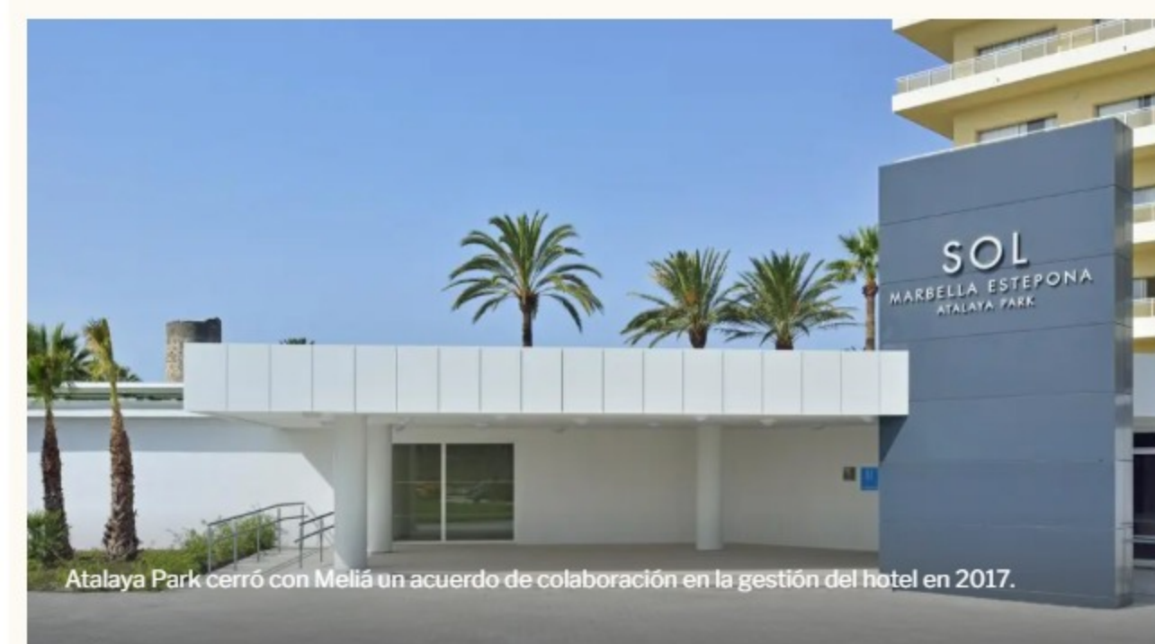
Atalaya Park cerró con Meliá un acuerdo de colaboración en la gestión del hotel en 2017.

Los dueños del hotel que gestiona la cadena Meliá percibirán 2,8 millones de euros en concepto de ayuda por las obras de rehabilitación que realizaron en 2018.